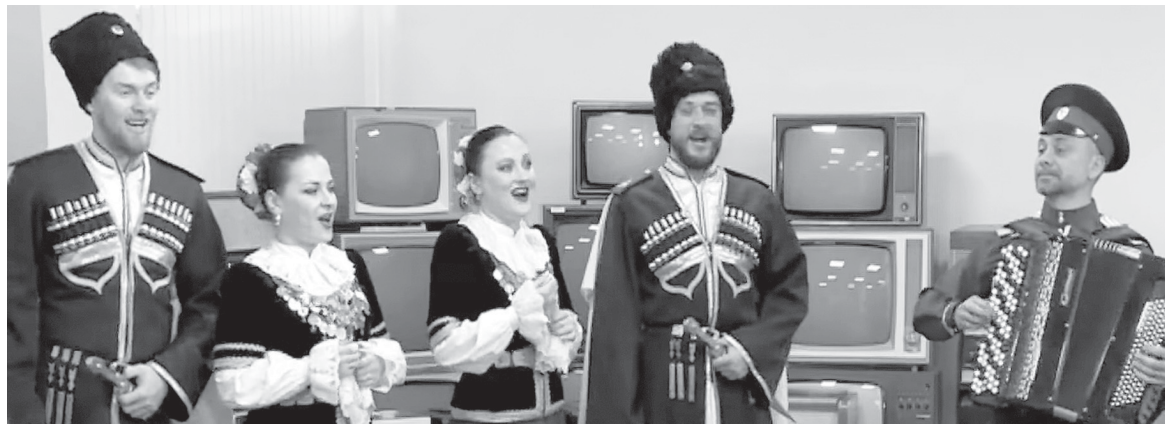
Артисты ансамбля «Ставрополье» выступили в прямом эфире в ходе пресс-конференции.

налах высочайшего класса, с которыми сотрудничал коллектив в разные годы: