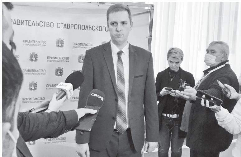
Министр имущественных отношений Ставропольского края Виталий Зритнев на брифинге в правительстве региона.

– В будущем году будут оценены все земельные участки – около 1,7 миллиона объектов всех категорий, – подчеркнул министр имущественных отношений Ставро-