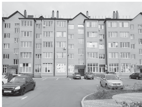
Дом с квартирами для детей-сирот.

Начало на 1-й стр. В течение следующего года они будут работать с органами федеральной исполнительной власти и местного самоуправления, с представителями профессионального сообщества. Это всё будет сделано для максимально-го наполнения сведениями той самой модели, на основе которой и будет определена кадастровая стоимость объектов.