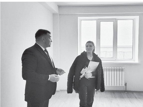
Качественный ремонт с гарантией.